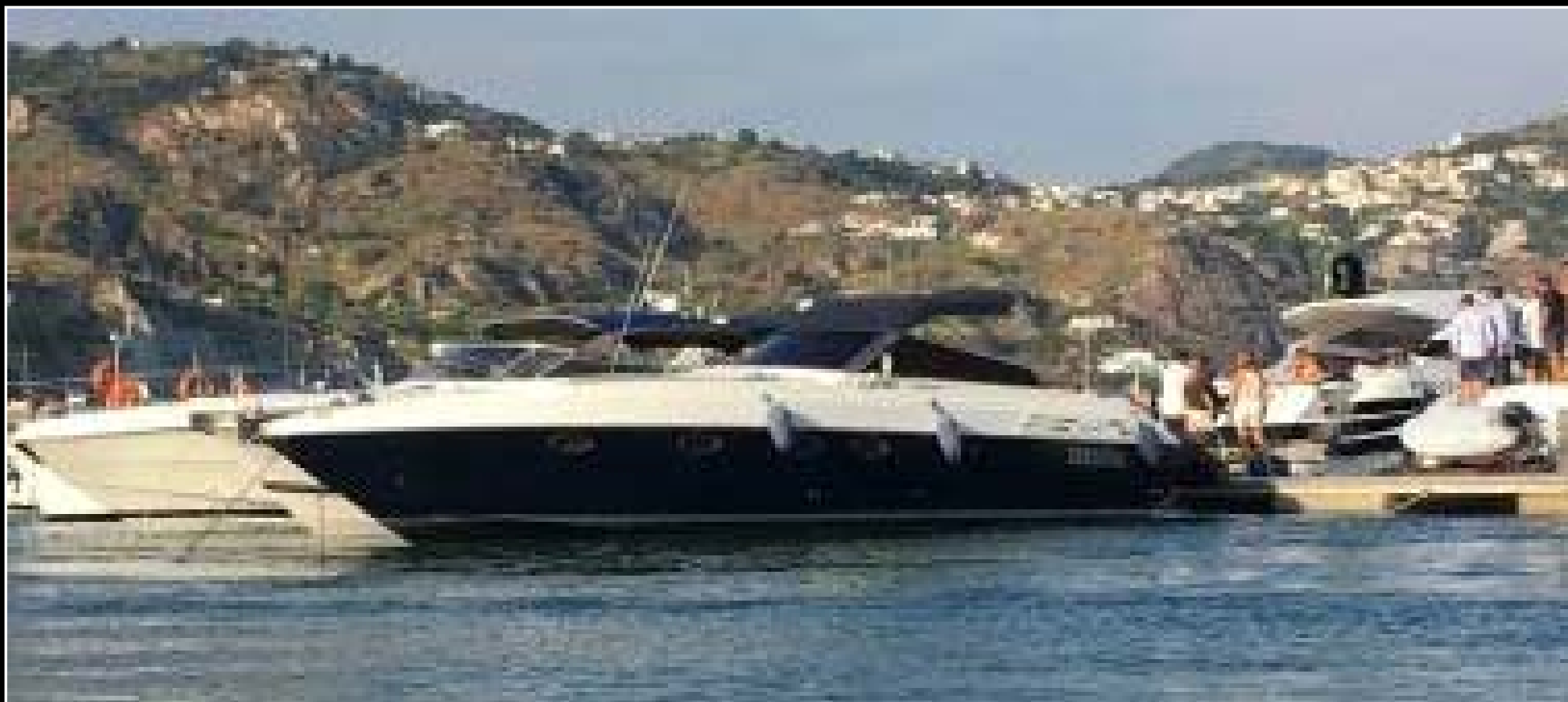
GAGLIOTTA EVEN 42