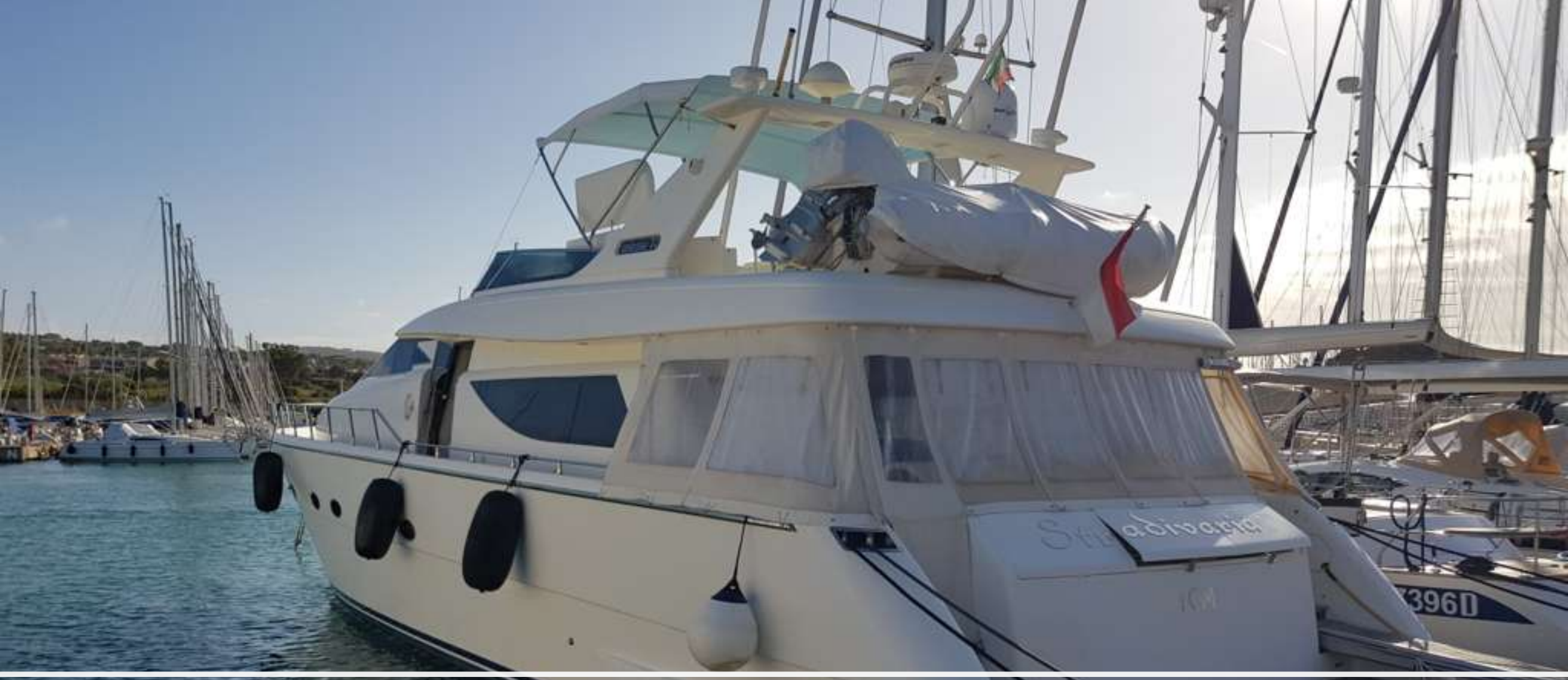
UNIESSE 72 MY